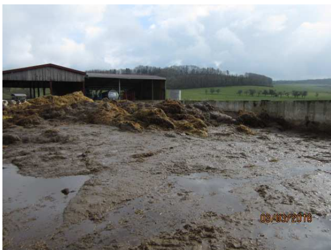
Stockage ouvert de fumier mou (issu principalement du raclage des déjections de vaches laitières)