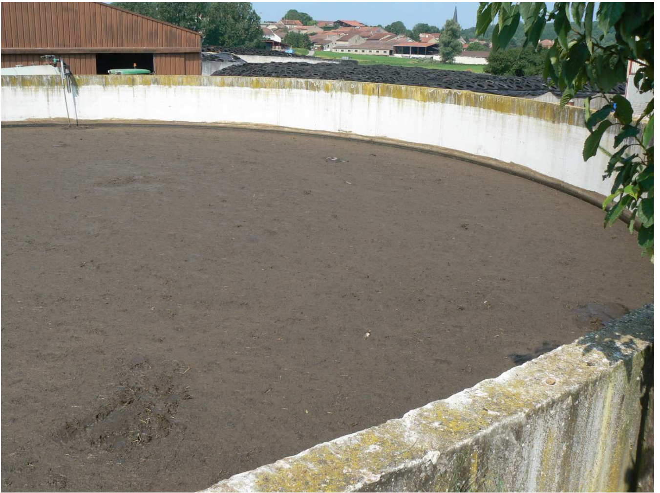
Exemple de fosse pour stockage d'effluents d'élevage (fosse à géomembrane)